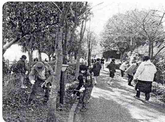
子どもたちと地域の方が一緒になり作業しました